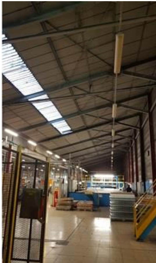
Ligne 21 – 1 rangée entière néons HS