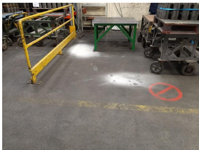
Atelier Moules – Poussières tombant du toit