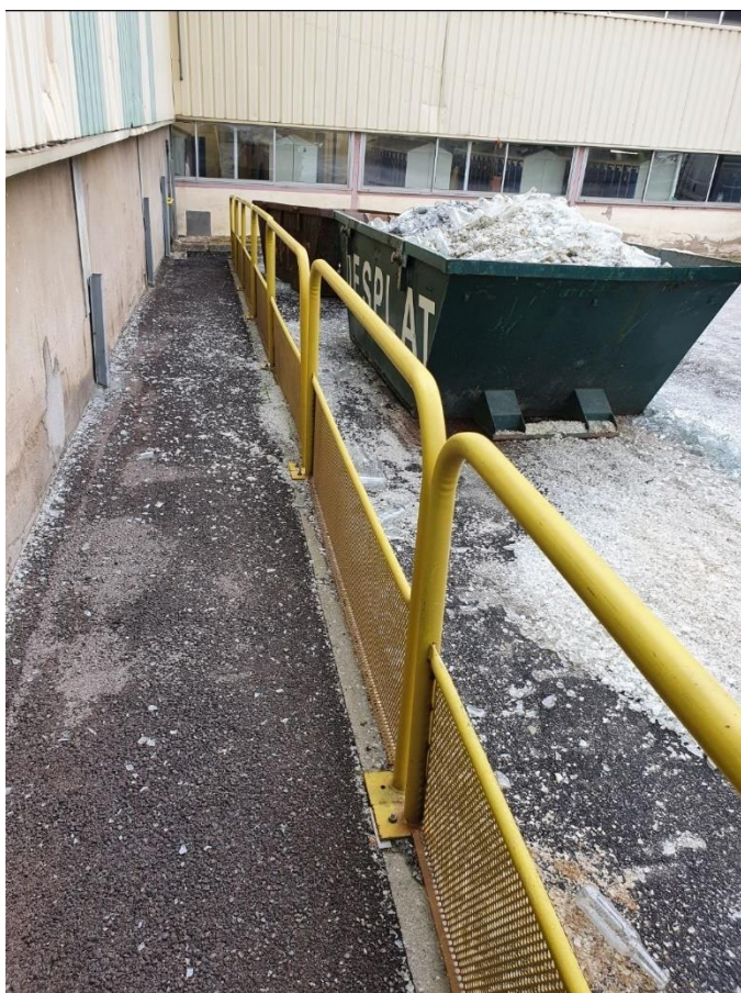
Passage piétons sans EPI Parking ⇄ Vestiaire