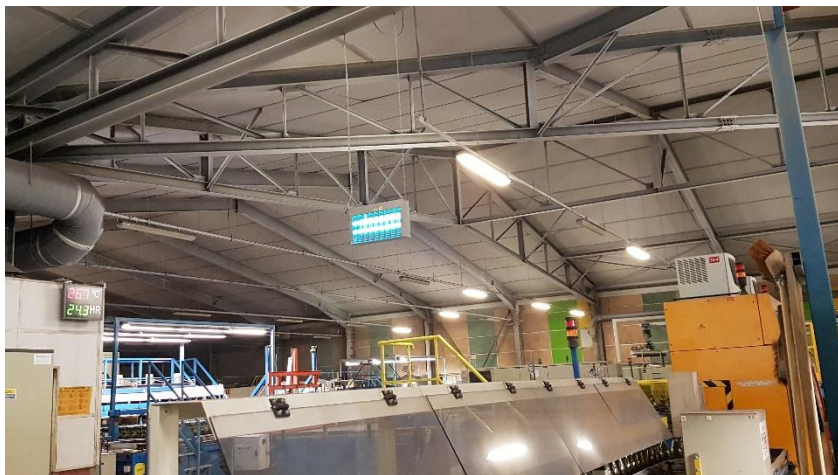
Four 3 – nombreux néons HS