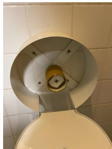
Toilettes Femmes Pas de papier toilette